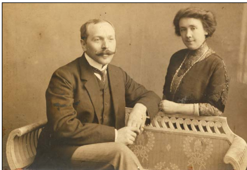
Figura nr. 3 – Henri Stahl împreună cu soția sa, Blanche (7 februarie 1912).