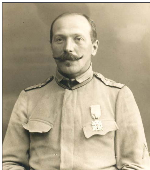
Figura nr. 12 – Henri Stahl, în uniformă de căpitan de infanterie. În piept poartă ordinul „Coroana României”, cu spade (de război), în gradul de Cavalier, primit „pentru bravura cu care a condus plutonul la atac în ziua de 17 septembrie 1916” ( Monitorul Oficial , nr. 235, 19 ianuarie 1917). (fotografie din anul 1917)

Iorga îi trimite spre încurajare cartea sa Relations des Roumains avec les alliés 22 , pe care Stahl va însemna cu cerneală neagră: „Căpitan H. Stahl, 21/4/1917 Gârleni” 23 . Deși reușește să îmbunătățească cu mult situația bolnavilor de la Gârleni 24 , Stahl sfârșește prin a contacta el însuși boala, probabil în jurul datei notate pe cartea lui Iorga. Boala își va pune amprenta asupra sănătății sale, fragilizând-o și grăbindu-i, în final, sfârșitul. Ironie a sorții, nevinovăția locotenentului condamnat la moarte prin executare pentru spionaj a fost ulterior recunoscută, fiindu-i restituit gradul post-mortem și dându-i-se onoruri militare la mormânt 25 .