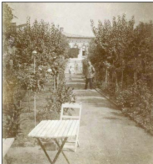
Figura nr. 6 – Henri Stahl, în uniformă de locotenent de infanterie, în grădina casei sale din strada Izvor. În fundal, fiul său Henri, viitorul sociolog (probabil vara anului 1912).