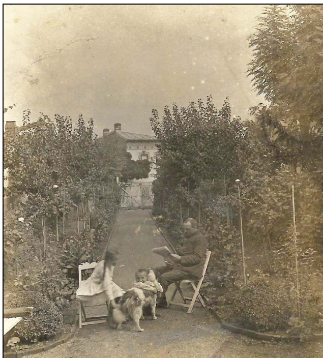
Figura nr. 7 – Henri Stahl, în uniformă de locotenent de infanterie, citind ziarul în curtea casei sale din strada Izvor. La picioarele lui, fiul și fiica sa se joacă cu un câine (probabil vara anului 1912).